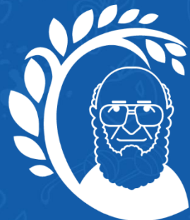
Escola de Formação de Educadores do Recife Professor Paulo Freire