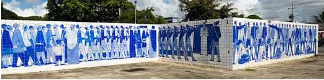
Painel- Corbiniano Lins (1967))