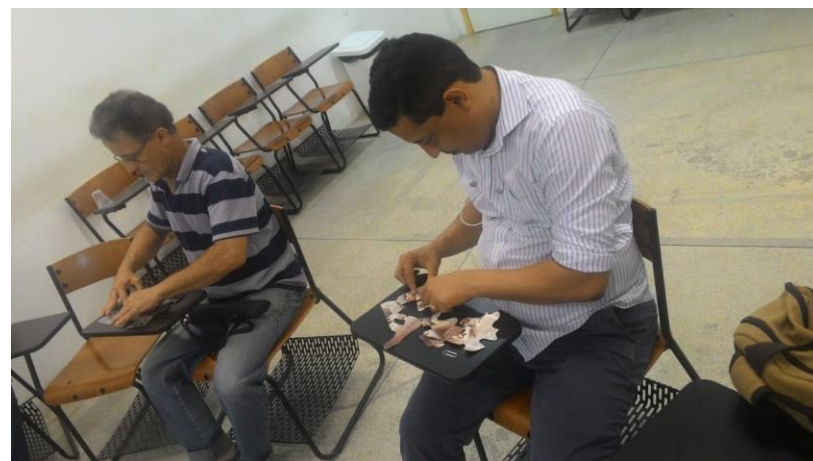
Acervo da equipe de formação.