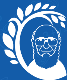
Escola de Formação de Educadores do Recife Professor Paulo Freire