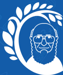
Escola de Formação de Educadores do Recife Professor Paulo Freire