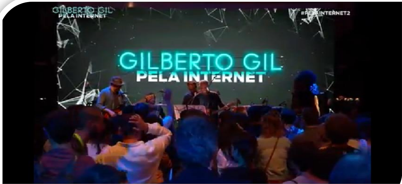
Pela internet 2 - Gilberto Gil

https://www.youtube.com/watch?v=15Q0aUu24gc