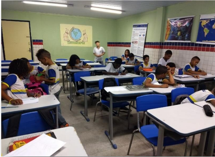
Proposta da formação com os estudantes do 6º ano B