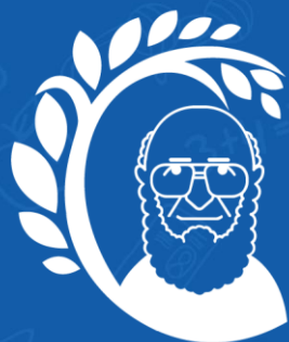
Escola de Formação de Educadores do Recife Professor Paulo Freire