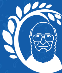
Escola de Formação de Educadores do Recife Professor Paulo Freire