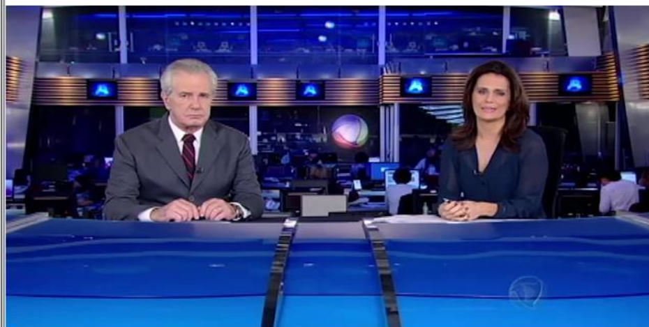
Documentário: Fake News

Segundo o documentarista este vídeo é um documentário de observação: Que características ele apresenta?