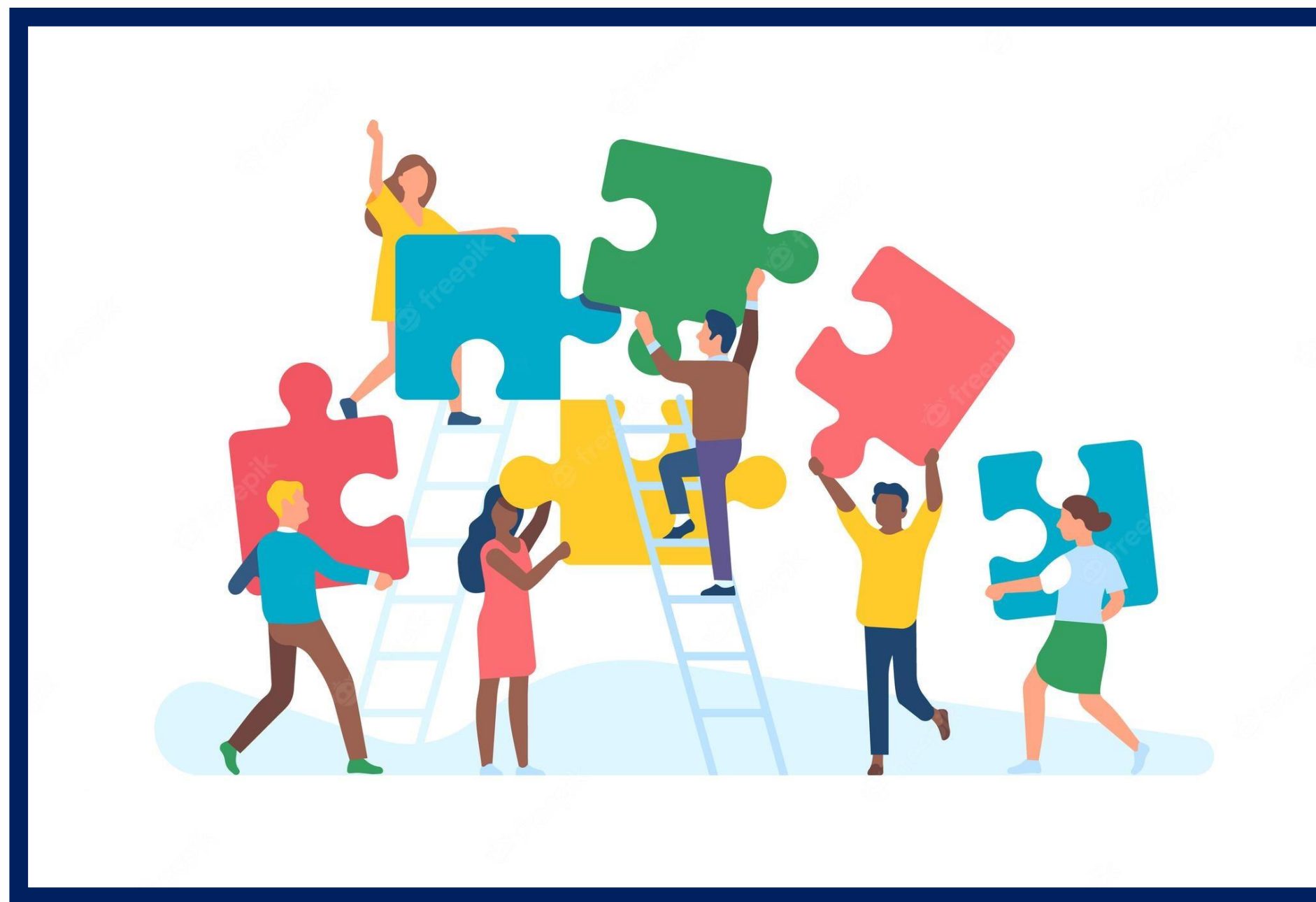
Imagem : https://br.freepik.com/vetores-premium/pessoas-minusculas-com-quebra-cabeca-homens-e-mulheres-coletam-grandes-pecas-de-quebra-cabeca-de-cores-trabalho-em-equipe-de-escritorio-otimizacao-de-trabalho-caso-comum-formacao-de-equipes-de-negocios-conceito-isolado-de-desenho-vetorial_20367657.htm

Relacione as palavras das tarjetas de acordo com os papéis do/da docente; do/da estudante e das características do projeto didático.