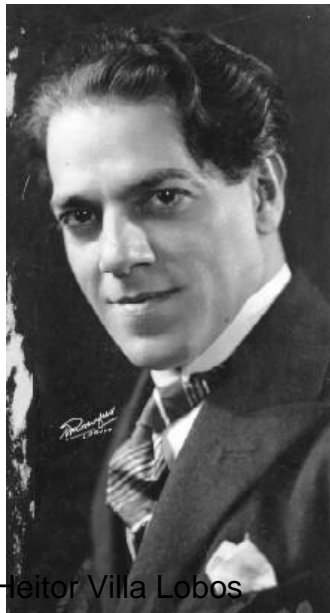
Heitor Villa Lobos

Olá, professor/a! Vamos iniciar nosso encontro virtual com o Trenzinho do Caipira de Heitor Villa Lobos.