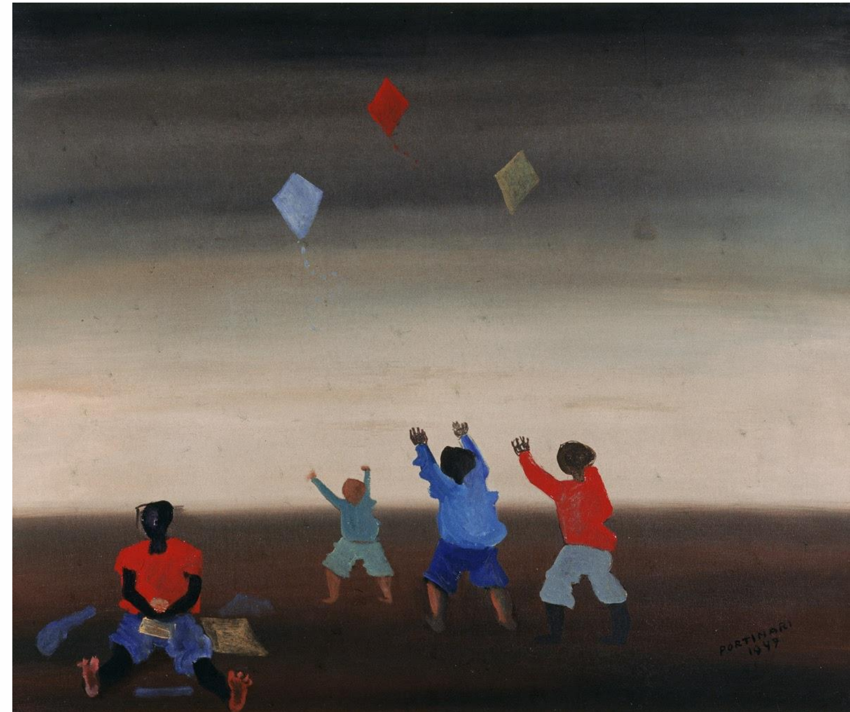
Pipas, Candido Portinari: https://artsandculture.google.com/asset/boys-flying-kites/mgF41eff21Mhg?hl=pt-br