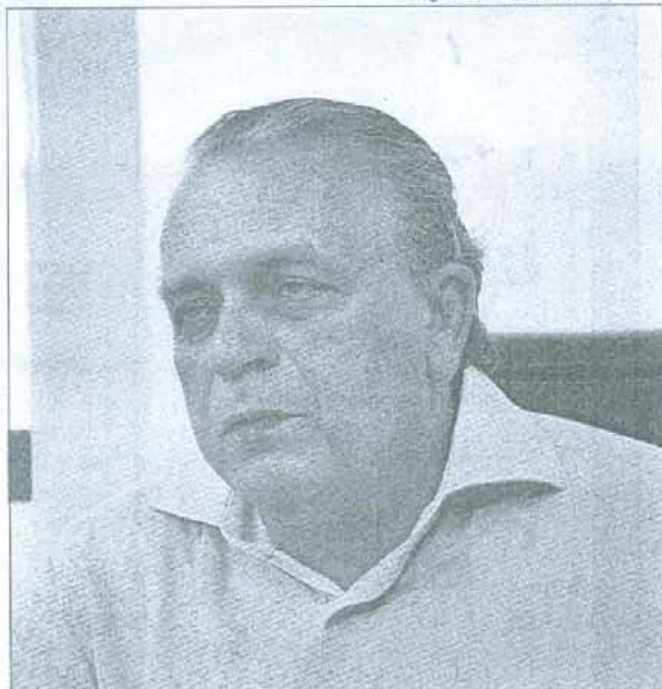
TUCANO diz que seu partido terá posição independente

Guerra está ciente dos planos dos parlamentares da Casa de Joaquim Nabuco de formar