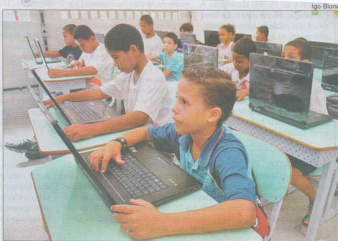
ALUNOS da Escola Rozemar de Macedo Lima foram os primeiros beneficiados

de Educação do Recife, Cláudio Duarte, a expectativa é que nesse ano possa ser intensificado o trabalho pedagógico, com o auxílio dos