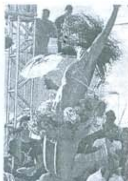
FREVO Candidatos marcaram passo

A escolha dos 26 finalistas do concurso para Rei e Rainha do Carnaval do Recife e do Baile Municipal, títulos unificados este ano, foi uma verdadeira maratona, ontem à tarde e no início da noite, no Cabanga Iate Clube, região central do Recife. O número de inscritos bateu todos os recordes e os jurados precisaram escolher entre mais de 200 homens e mulheres. Quase quatro horas depois de desfiles, trocas de roupas e mobilização das torcidas organizadas, saíram os nomes de quem vai disputar as coroas do casal real dos festejos de Memo no Recife, próximo dia 26, no Chevrolet Hall, em Olinda, Grande Recife.