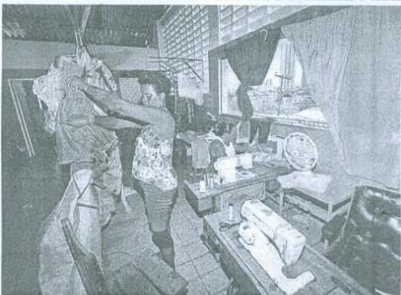
Clube Príncipe/JC Imagem

Confira mais de fotos no JC Online www.jc.com.br