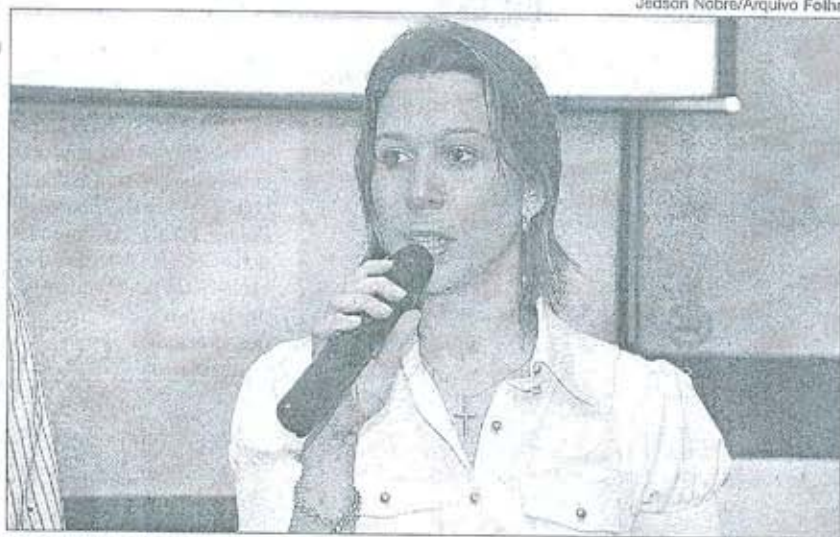
TATIANA: percentual de quem chega de avião aumentou de 2007 para cá

O ano passado também foi um ano de grandes eventos na