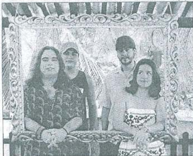
BANDA fará show dia 6 março, no Pátio de São Pedro

A vontade da banda é não restringir seu alcance a espaços de fruição visto como menores e manter um diálogo