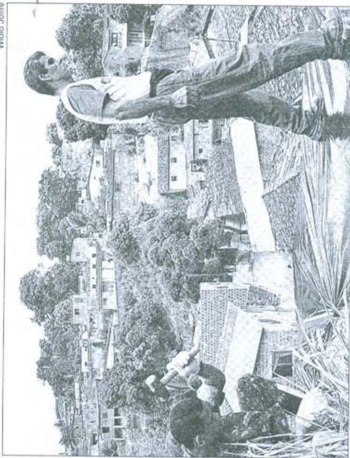
HAVERÁ colocação de lonas, cortes de árvores, retirada de entulhos e capinação

depois que a barreira cair", disse, lembrando que na década de 70 já aconteceu um acidente com barreira na localidade, que deixou sete pessoas mortas.