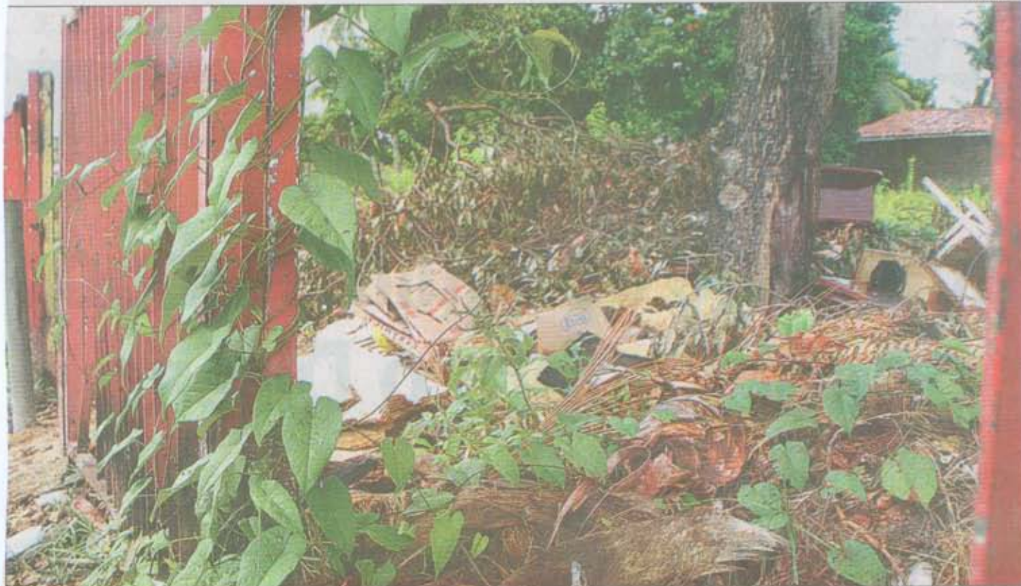
NA PRAÇA do Forte há grande quantidade de entulhos e lixo. Matagal está alto e há muito tempo não é capinado