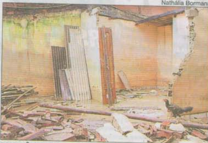
RESIDÊNCIA foi arrastada pela correnteza da rua rio Xingú