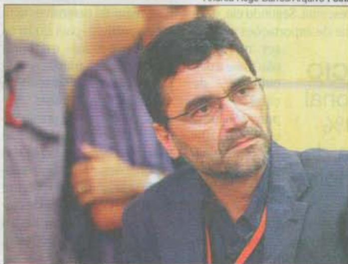
SECRETÁRIO destaca resolução de pendências