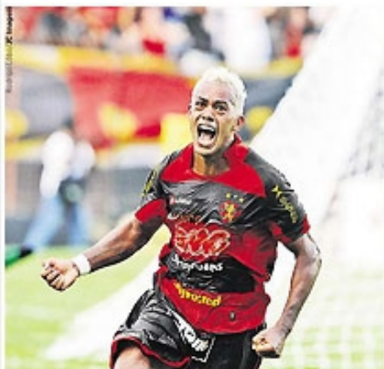
MAESTRO Paraíba consoude o time rubro-negro e vibra muito ao marcar o segundo gol

Em clássico vibrante, Leão fez 3x1 em cima do Náutico, na Ilha, e leva grande vantagem para o jogo da volta, nos Afritos. Em Caruaru, Santa bateu o Porto por 2x1 e decide vaga no Arruda podendo perder por 1x0. © esportes 1 e 4 a 7