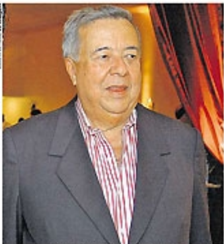
Ex-deputado federal e articulador da aliança PMDB/PTI que elegeu Jarbas governador falôco em São Paulo, aos 75 anos. © caso dois e página 2

Há quem recuse convite para o casamento real