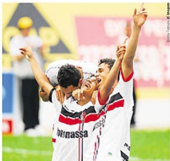
GIGANTE O peçoço Resatinho garante a vitória tricolor e foi festejado pelos companheiros