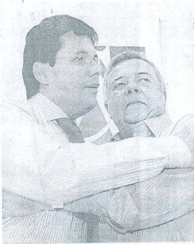
EM FAMÍLIA José Mendonça com o filho governador, em 2006

O filho mais velho do ex-parlamentar, deputado federal Mendonça Filho (DEM), tomou um voo para São Paulo assim que soube da morte do pai. O corpo de José Mendonça foi transferido ainda ontem à noite para o Recife, e será velado durante todo o dia de hoje na Assembleia Legislativa. No fim da tarde, será levado para Belo Jardim, onde também será velado até o sepultamento, marcado para amanhã, em horário