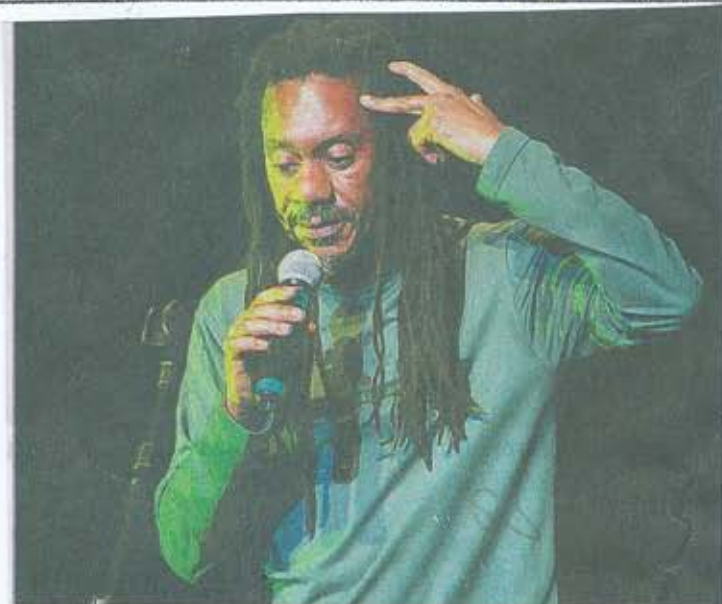
CLÁSSICO Luiz Melodia em dose dupla no Seis e Meia