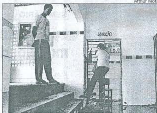
FUNCIONÁRIOS tiveram dificuldade de circular na unidade

não é a primeira vez que alaga na escola durante esse período chuvoso, contudo, nenhuma outra vez foi tão devastador. "Nas outras vezes, a maior quantidade de água chegou a atingir até três palmos, mas como desse jeito foi a primeira vez. Em outras vezes foi somente lavar tudo e reiniciar as aulas, mas agora não tem como, infelizmente", disse.