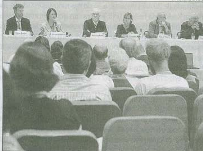
BOTLER (E): "primeiro passo é construir boas calçadas"