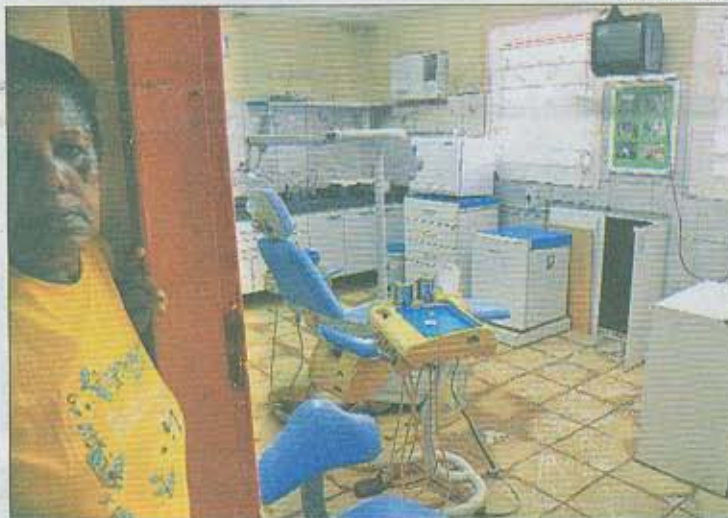
LAMA invadiu as salas e danificou equipamentos