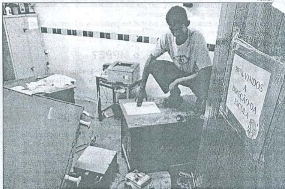
SALA da diretoria da Escola Municipal Cícero Franklin Cordeiro foi revirada