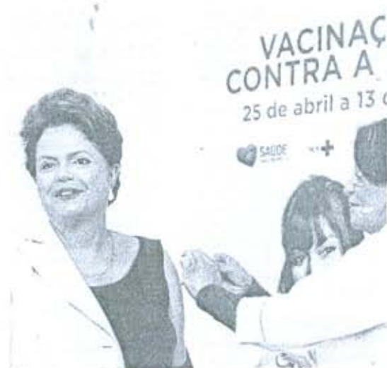
PÚBLICO-ALVO Acima dos 60 anos, presidente faz sua parte

Dilma garantiu que não faltaria doses para vacinar todo o público esperado. "Vai ter vacina para todo mundo. Então eu faço um apelo para as mães de crianças de seis meses a 2 anos e para as grávidas para que não deixem de se vacinar. E as pessoas acima de 60 anos também. Eu estou na categoria acima dos 60 anos", disse ela, que tem 63 anos. Bem-humorada, a presi-