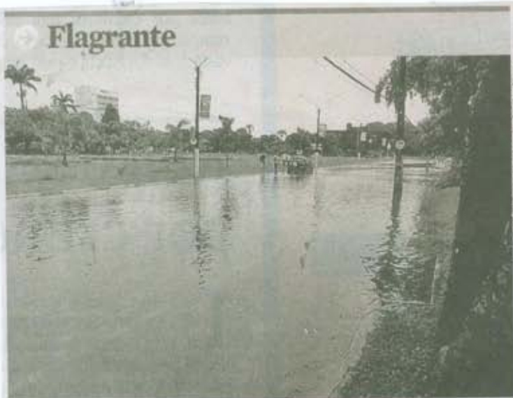
Tarcísio Ferreira/Voz do Leitor