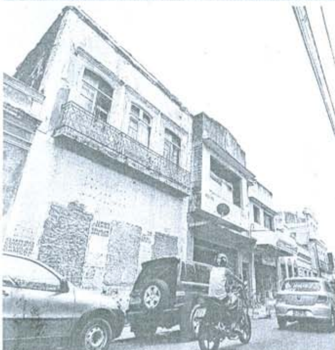
PONTOS Maioria dos prédios na Boa Vista histórica está abandonada. Imóvel que desabou na Rua Velha, em 2006, matando 7 pessoas, está sem uso até hoje