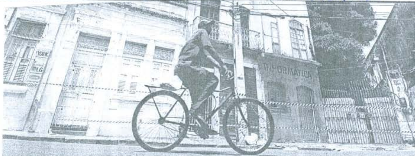
SEM CONSERVAÇÃO Após parte do piso do 1º andar e da coberta do casarão de nº 187 desabar na quinta, outros três imóveis foram isolados na Rua da Glória