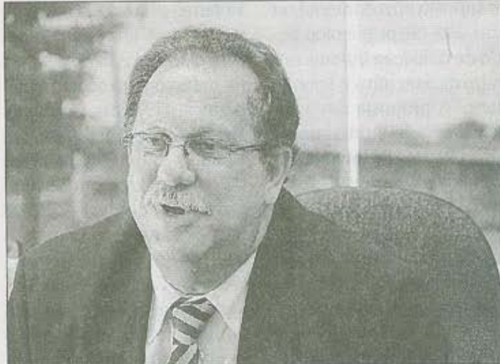
PREFEITO de Lajeado será presidente por mais dois anos

Na lista das prioridades para a sua nova gestão, o presidente reeleito citou a luta pela desburocratização na libera-