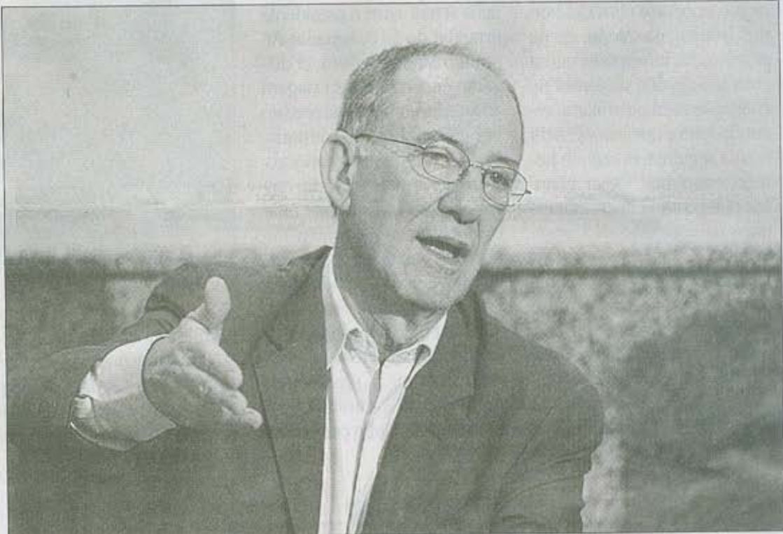
FALCÃO deve ser oficializado no cargo amanhã para um mandato de três anos

Rui Falcão, que é vice-presidente do PT, perdeu pontos com Dilma ainda na época da campanha, por ter seu nome envolvido no escândalo de arapongas que vazaram informações sobre o sigilo fiscal do então candidato a presidente, José Serra (PSDB). Falcão estaria por trás do vazamento, cujo resultado foi o isolamento do hoje ministro da Indústria e Comércio, Fernando Pimentel (PT), amigo da presidente. A motivação do deputado seria uma disputa interna no partido.