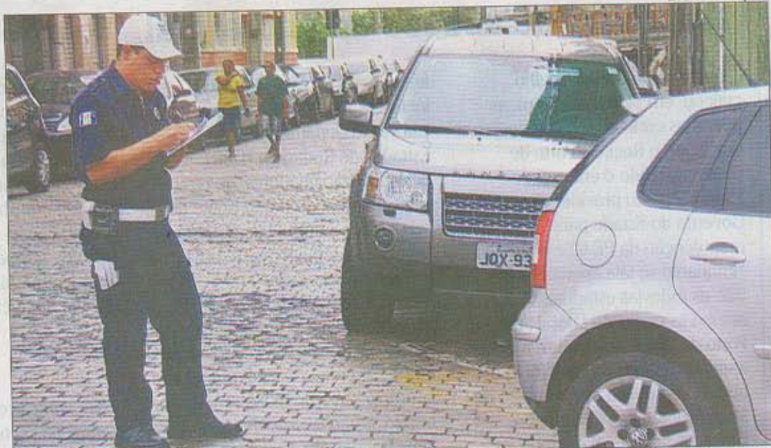
RETIRADA do calçamento refletiu na falta de estacionamento, gerando muitas