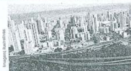
Complexo Viário da Av. Antônio Falcão

A Via Manguê vai melhorar o trânsito entre o centro e a zona sul da cidade. Um sonho de muitas gerações de recifenses que a Prefeitura, em parceria com o Governo Federal, agora está tornando realidade.