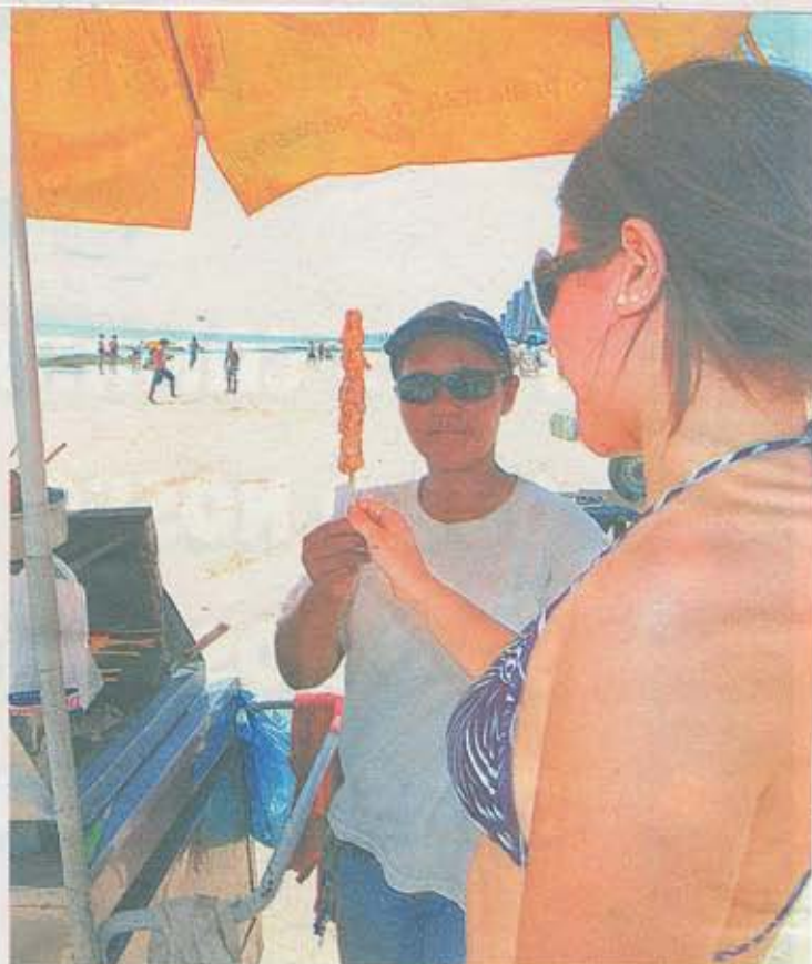
Praia de Boa Viagem passa por um reordenamento

O cadastramento também vai colher informações para a preparação de novos cursos de qualificação oferecidos pelo Projeto Orla, por meio de parcerias com as secretarias de Turismo, Cultura, Desenvolvimento Econômico e Saúde, além do Sebrae.