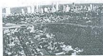
Ponte sobre Lagoa Encanta Moça

Nas áreas por onde a Via Manguê vai passar um total de 992 famílias - a maioria vivendo em palafitas - ganhará casa nova. Um habitacional já foi entregue, na Imbiribeira. E mais dois serão entregues ainda este ano, no Pina. Além das moradias, a Prefeitura constrói redes integradas de saneamento.