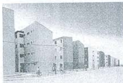
Habitacional Via Manguê III

A Via Manguê é a primeira grande obra estruturadora da Copa de 2014 no Recife. Além de criar uma nova alternativa de tráfego, permitirá que os recifenses e turistas conheçam uma das áreas verdes mais bonitas da cidade.