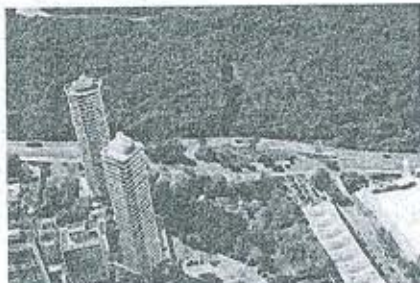
Novos retornos e praças